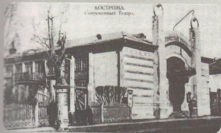
«Современный театр» Трофимова

киноактёром и тоже снимался, а я когда-то учился на сценарном факультете Всесоюзного Государственного института кинематографии. И вот мы втроём пытались вспомнить фильмы, снимавшиеся в Костроме. Перечисляли, перечисляли... Где-то на четвёртом десятке сбивались. Позже я уже встретил мнение, что таких фильмов, где фоном действия была хотя бы в эпизоде Кострома, более шести десятков, причём, не только советско-русских, но и венгерских, итальянских, немецких... И ещё одна характерная деталь: среди этих фильмов нам удалось вспомнить лишь один, где фигурировали бы современные реалии Костромы. Это фильм «Убегающий август» с пляжем, автопешеходным мостом, с главным