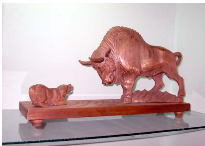
«Заповедник» Николая Масленикова