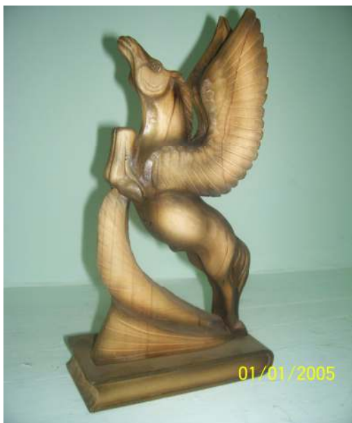
Авторские работы мастера