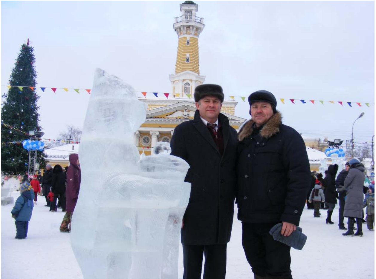
III областной фестиваль-конкурс снежно-ледовых скульптур «Зимняя сказка-2011». Название работы «Кострома – хлебосольная»