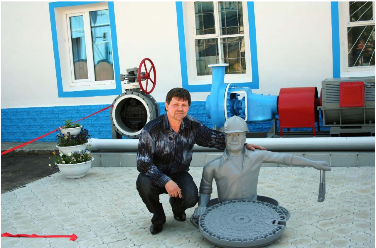
Памятник «канализационщику». Автор Николай Маслеников