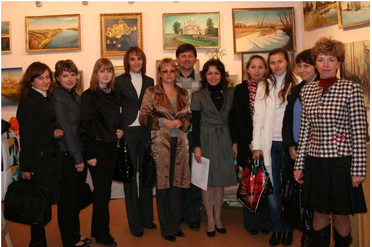
Участники семинара «Возрождение народных обрядов и традиций для классных руководителей общеобразовательных школ города»